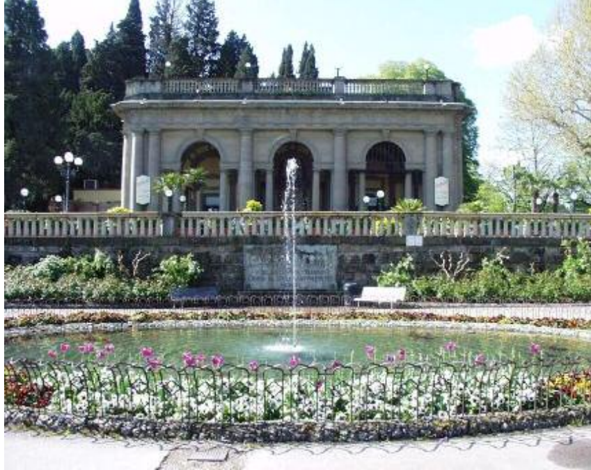
دیمەنیکی کۆشکی سەرۆکایەتی، ئیتالیا Palazzo Vecchio